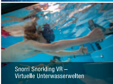
Snorri Snorkling VR – Virtuelle Unterwasserwelten