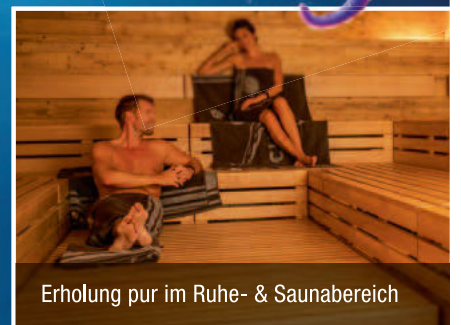
Erholung pur im Ruhe- & Saunabereich