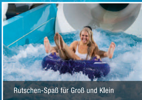
Rutschen-Spaß für Groß und Klein