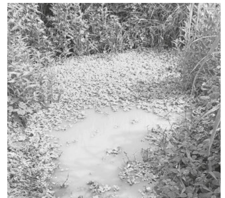
Wasserloch bisher für Mensch und Tier in Togo

Samstag 28.11. von 8.00 bis 12.00 auf dem Wochenmarkt in Heitersheim, außerdem ebenfalls Samstag Vormittag am Kronenbrunnen in Staufen.