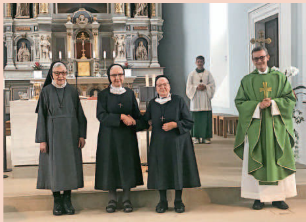
Verabschiedung von der Kirchengemeinde im letzten Sonntagsgottesdienst