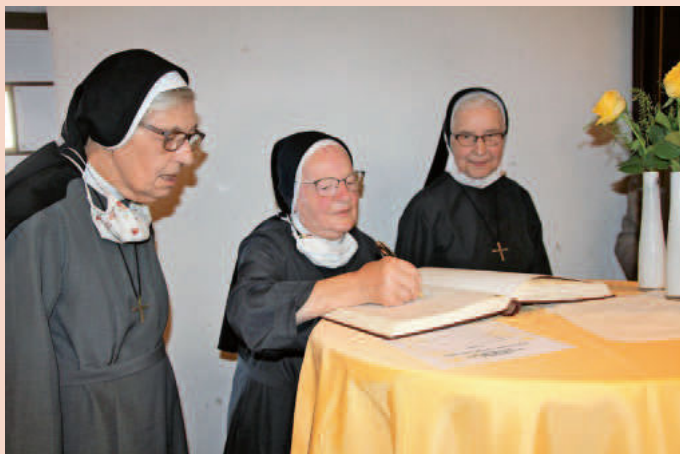
Eintrag ins Goldene Buch der Stadt Heitersheim