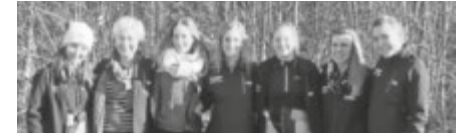
Strahlende Gesichter beim Aufsteiger in die 2. Bundesliga

eigentlich einfach. Ich musste sie nur auf unser Saisonziel hinweisen und ihr klarmachen, dass man mit den letzten 18 Schuss auch 18 Zehner schießen kann. 17 mal konnte sie es umsetzen“ erzählte Schmid schmunzelnd. Der Rest war dann nur noch feiern mit den zahlreichen Schlachtenbummlern, die den Weg nach Pforzheim nicht gescheut haben.