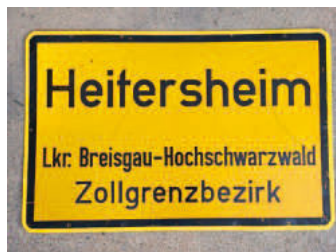
Ortschild 1.1: Vorderseite