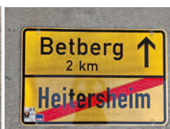
Ortschild 2: Rückseite