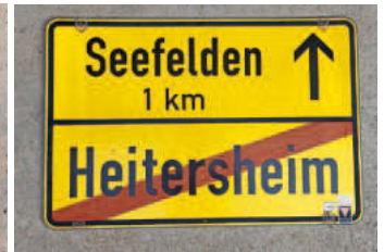
Ortschild 3.2: Rückseite