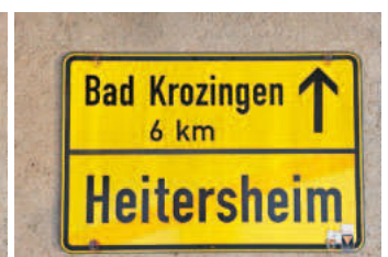
Ortschild 7: Rückseite