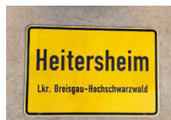
Ortschild 7: Vorderseite