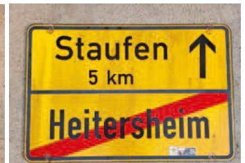
Ortschild 6: Rückseite