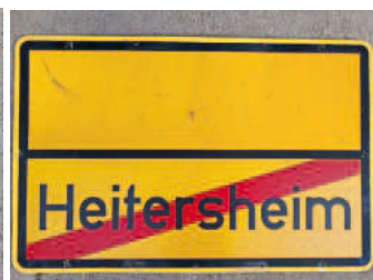
Ortschild 1.1: Rückseite