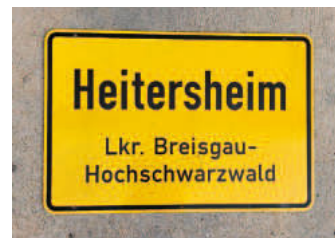
Ortschild 5: Vorderseite