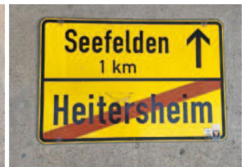
Ortschild 3.1: Rückseite