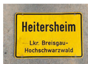
Ortschild 8: Vorderseite