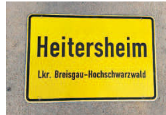
Ortschild 3.2: Vorderseite