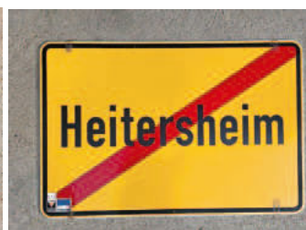
Ortschild 1.2: Rückseite