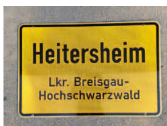
Ortschild 2: Vorderseite