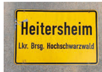
Ortschild 4: Vorderseite