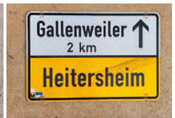
Ortschild 5: Rückseite