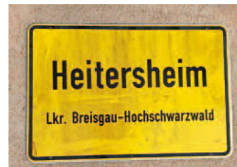
Ortschild 6: Vorderseite