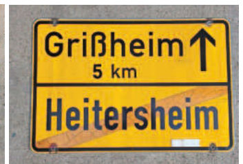
Ortschild 4: Rückseite