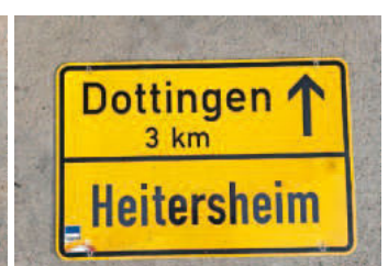
Ortschild 8: Rückseite