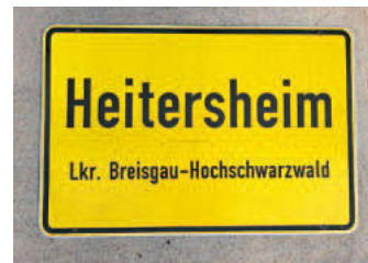
Ortschild 3.1: Vorderseite