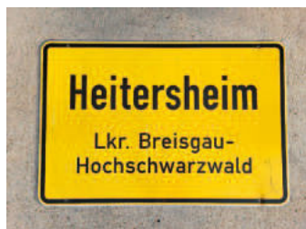
Ortschild 1.2: Vorderseite